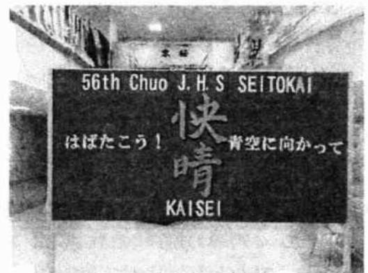
第56期生徒会テーマ「快晴」